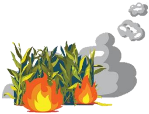
การเผาในที่เกษตร