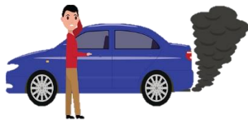
การคมนาคมขนส่ง