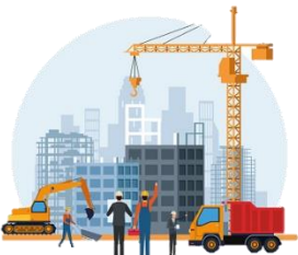
การก่อสร้าง