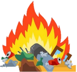
การเผาป่า เผาขยะ